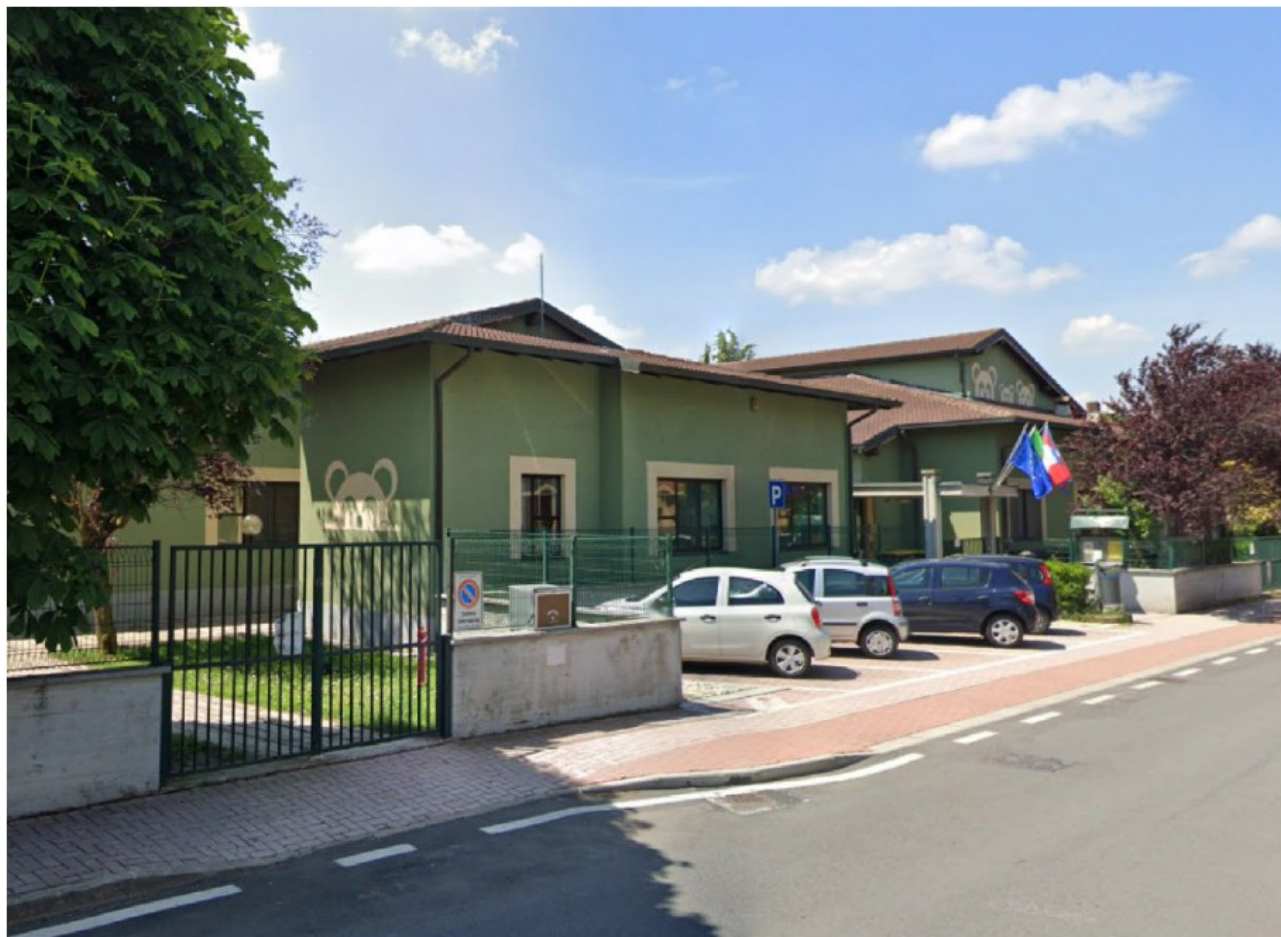
Foto 1 Scuola Pajetta-Andersen esistente su via Morandi