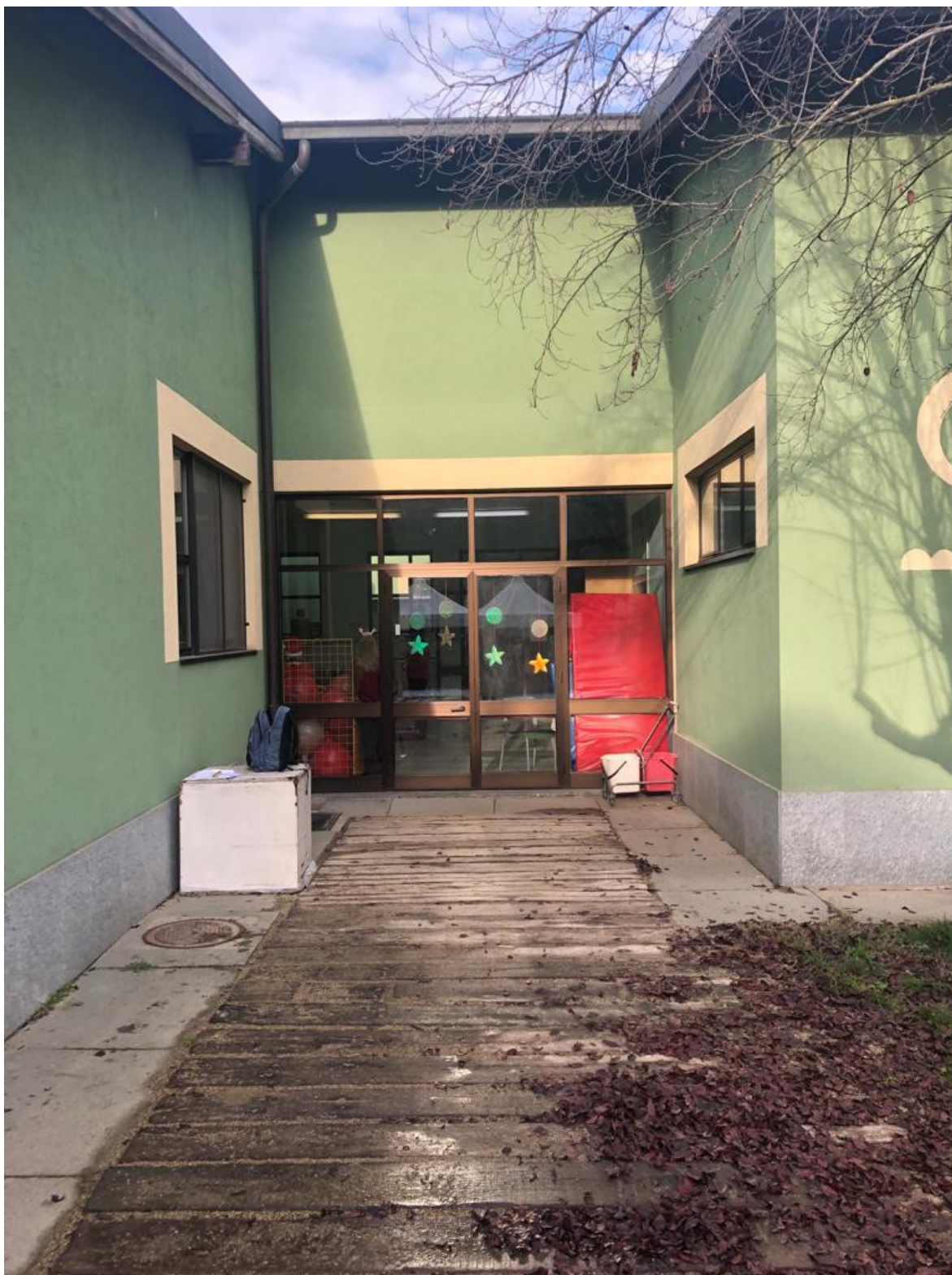
Foto 4 Ingresso attuale allo spazio Polivalente verso ampliamento