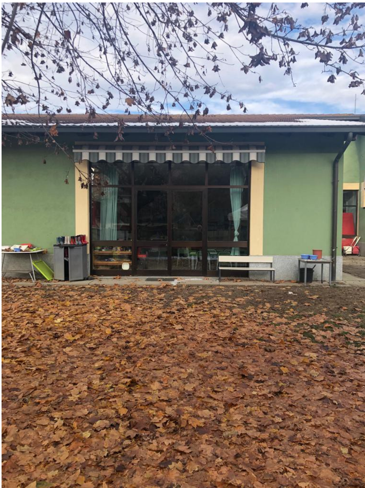
Foto 3 Facciata scuola Pajetta-Andersen esistente fronte Sud